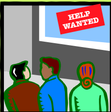
Tan pronto te dediques a la búsqueda de trabajo, te enfrentarás a la solicitud de empleo.

☞ Certificado de Nacimiento-Los patronos verifican tu fecha de nacimiento, así que es buena idea que tengas una copia a la mano.